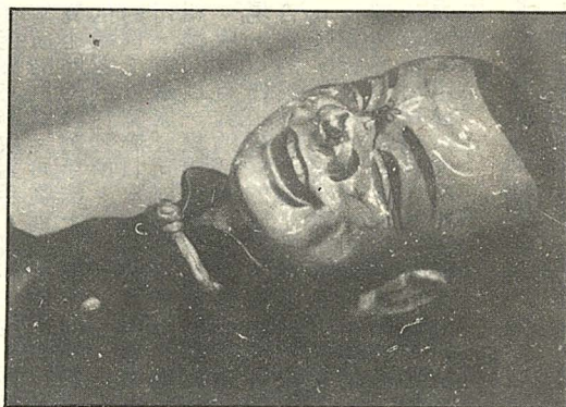
傳統技藝後繼有人，連木偶都笑了