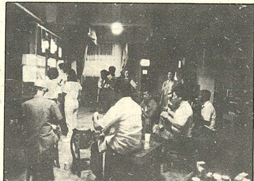
後台一切毫不馬虎