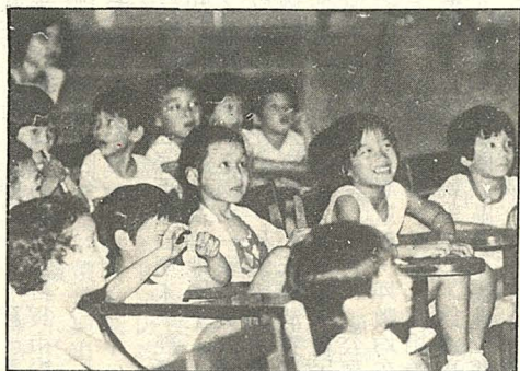
華岡兒童中心的小朋友是第一場「秀」的觀眾