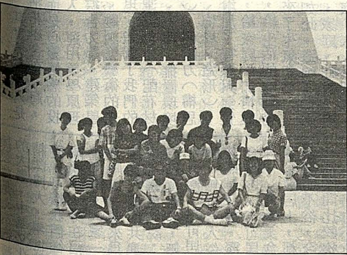
華語研修團全體合影

才接觸一個月，若說能多了解日本人，是不可能的。但經由這次活動，使得日文組同學有了深深的共識：那就是不同文化背景、風俗習慣的人們，雖有著種種的差异，但卻可以靠著時間，以及人與人之間的包容力，而達到溝通及交流，既而日久生情。所以小老師們均和學生建立了深厚的友誼。 綜觀此次研習，對日文組同學而言，著實提供了一次寶貴的實習機會，使得我們能跳出歷史印象的窠臼，與我們所學的語文相配合。日本在客觀環境下有形之進步，自不待言，然我們對其無形之意識形態（如集團意識、國民教養），更有深刻的認識，而這意識形態正足以說明戰後日本何能上下一心，團結一致，而以最快的速度復興經濟，重整家園，進而晉身世界上的經濟大國了。在歐美各國漸漸把注意力轉向日本之際，我們與其活在東洋文化的恐懼之中，不如以客觀、理性的態度去面對日本、認識日本人！