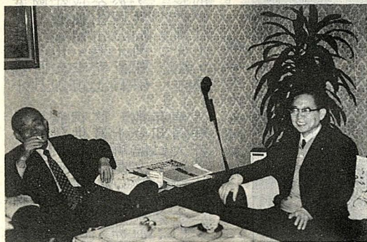
筆者(右)與日前首相福田起夫(左)歡談情形

和約簽訂後由于中共在大陸的倒行逆施，對於日本復一味以高壓威脅臨之，所謂「中」蘇對日防衛條約的訂立，更