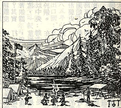
靜寧受享，境環美優身置

在組織嚴密的羅浮羣糧食組，使你衣食無慮，器材組使你活動方便，還有信用卓著，十五年辦活動經驗的華岡羅浮羣伙伴們。