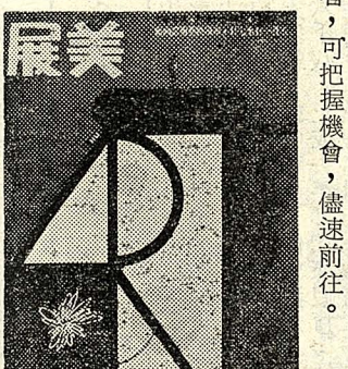
美展將於明（七）日閉幕，未曾觀賞者，可把握機會，儘速前往。

【本報訊】美展自即日起，在國立藝術館揭幕至今，歷時五日，連日來參觀者絡繹不絕。 此次展出的內容極爲豐富，左邊畫廊懸掛三十幅國畫、書法及篆刻，右邊畫廊懸掛三十五副西畫及設計圖，各以不同筆法，表現相異風格，相互輝映，令人有目不暇接之感。 美展將於明（七）日閉幕，未曾觀賞者，可把握機會，儘速前往。