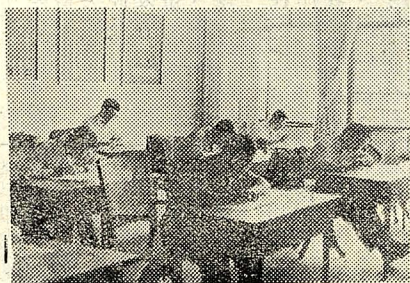
圖為博士學位考試情形

【本報訊】本校首次博士學位學科考試，昨日假勞工研究所舉行。他八位為第一屆博士班研究生。考試成績將於本月中旬揭曉。