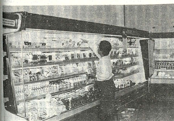
冷凍貨架整齊美觀

若再加上線碼系統的配合，則貨品的進出，有了一個明確的指標，在採購與盤存時人力使用的效率上可提高很多。此外在購物人潮多的時候，依線碼系統的電腦掃描，可迅速決算，以節省消費者的時間。