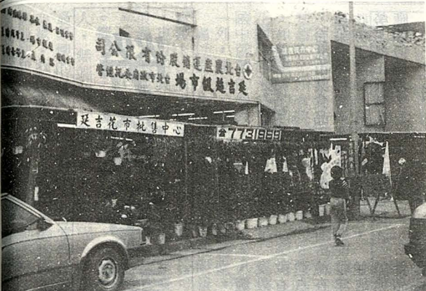
花市為其特色所在

然而與現有的其他超市比較起來，延吉超市除了在價格、服務上有異於其他超市的獨特作法外，其他方面仍有尚待改進的地方。例如在倉儲作業上，可以電腦化來加強控制，使得存貨可以維持一個最低的安全存量，