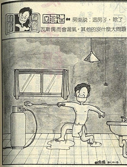
房東說：這房子，除了瓦斯偶而會漏氣，其他的沒什麼大問題。

和意外事件。（如校區附近某MTV場地狹小，進出門僅有一個，若遇火警，後果不堪設想。） 十一、同學們發現問題，應主動與房東聯繫；未果，可逕向導師、輔導教官報告，由教官協調警員前往處理。 「華岡是一個大家庭」，對於離鄉背井、賃居校外的同學來說，學校的師長將給予更多的關懷，協助同學們擁有一個「安全、舒適」的生活環境。對於本月九日教官們訪問所見，訓導處已協調山仔后地區員警處理，若同學們有更好的意見，可逕向訓導處提供。