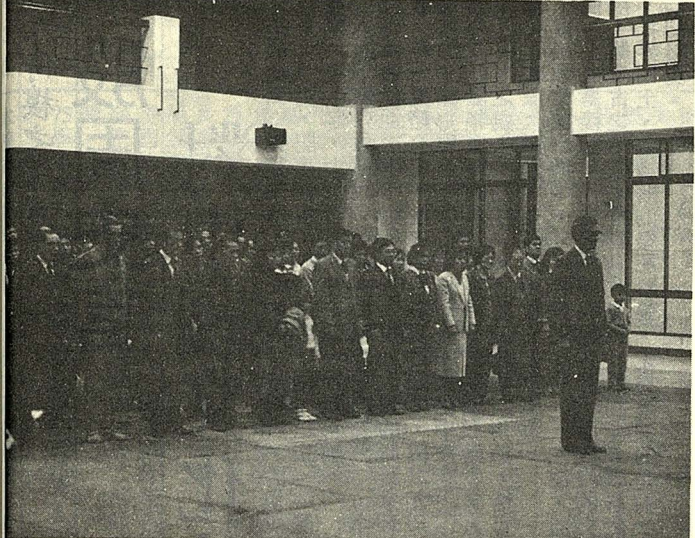
• 鄭校長率領教職員向蔣故總統致祭