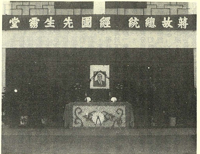
• 設於大孝館演武廳之蔣故總統經國先生靈堂