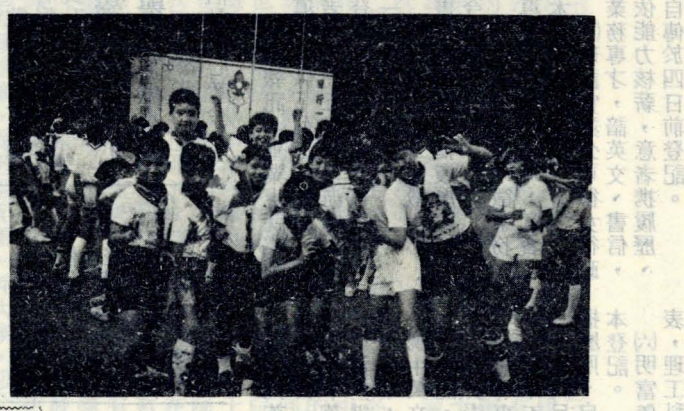
右圖：幼童軍在陽明山苗圃夏令營活動情形。 上圖：幼女童軍宣誓晉級儀式。