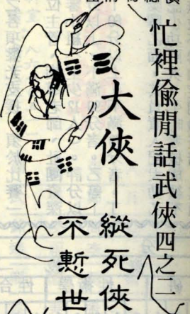
忙裡偷閒話武俠四之二 大俠——縱死俠骨香，不慙世上英。 漢民學社

努力做個真正的「人」而已。 正義地生，威嚴地怒，轟烈地死，正是俠義之士，挾其高度的理想主義，在社會是非不明，觀念不清時，所做出以維繫人性尊嚴於不墜的怒吼！一個俠客出現最頻繁的時代，想必是最悲感的時代！ 附：漢民學社舉辦「我對俠義精神的想法」徵文比賽，即日起至四月底止收件，有興趣者請以稿紙書寫，以信封裝妥，投至系信箱文學二胡梅霖收。 歡迎全校同學踴躍投稿。