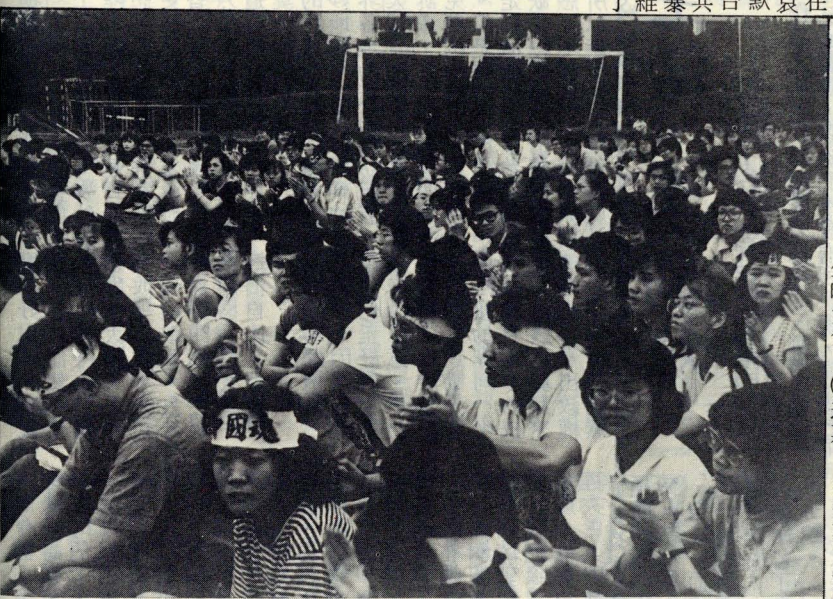
？ 嗎 遠 會 還 明 黎 ， 盡 已 夜 長 。

青年代表及名人講話、歌曲演唱、詩歌朗誦、大合唱等。活動報到時間為當日下午四時，本校綜合性社團成員可直接至中正紀念堂國家劇院正門口（面對廣場）處，目標為中國文化大學校旗。居住山上同學可於下午三時廿分至大成館新聞系館前，搭乘專車前往。歡迎綜合性社團成員踴躍參加，並歡迎携伴。參加人員以禁食一餐為原則，表示同申哀悼之意。