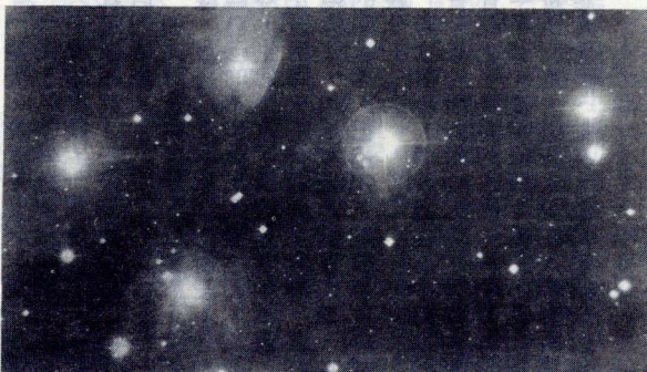
附圖一·M45七姊妹昴宿星團（屬疏散星團）

年興起一陣「浪漫主義」的風潮。所謂浪漫主義，顧名思義，便是指相對於古典主義的一種思潮，一種文學運動。由於中產階級逐漸興起，社會結構發生變動，新階級的人們開始對現存的社會、政治秩序，對多數人受限制於少數貴族的制度是否合理，產生了懷疑和重新評估。不但要求人權平等和行動自由，且希望擺脫經濟與政治方面的約束，一切行動均憑一己的良知來指導。於是逐漸造成一種新的趨勢，新的潮流，最後匯集成通稱的浪漫主義。