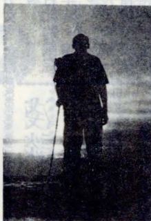
(節錄自張默「小詩選讀」)