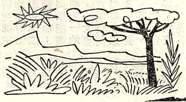
去中抱懷的然自大到。師導的們你做然自讓