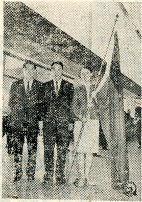
文代與辭已於昨(十七)日返國抵達松山機場時，全體團員在國旗前導下步出停機坪(圖①)。楊希震院長及戲劇系主任王生善與旗的女團員合影(圖②)。董事長張其均在華崗設宴款待舞蹈團團員(左二)及鐵人(楊傳廣右二)應邀作客。