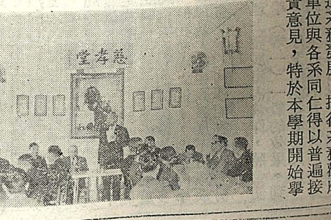
本校為促進系務發展，推行系務觀摩，並使行政單位與各系同仁得以普遍接觸，聽取寶貴意見，特於本學期開始舉辦「一星五餐」。