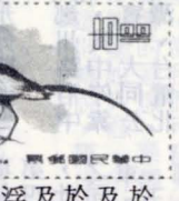
水雉屬水雉科，分佈於印度、華南、菲律賓及台灣等地。