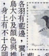
水雉屬水雉科，分佈於印度、華南、菲律賓及台灣等地。