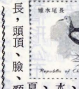
大冠鷲屬 鸞科，分佈於中國大陸、印度馬來、菲律賓、律賓及台灣。

黑長尾雉又名帝雉屬 雉科，分佈於1800-3200公尺間的原始針葉林中，主要棲息於森林下層及有濃密灌木、竹叢之陡峻山坡上。習慣於黎明或黃昏時出來覓食活動，性安靜隱密。特徵為雄鳥全身為深藍色、臉紅色，背以下各羽有藍邊，翼上各有一白色橫紋。雌鳥大小及顏色與雄鳥相似，全身黃褐色，身上有不十分明顯的淺色縱紋。水雉屬水雉科，分佈於印度、華南、菲律賓及台灣等地。主要棲息於農耕地、池塘、湖泊及沼澤地帶，常在水面浮草上及蓮花葉上漫步覓食，築巢於蓮葉及水仙花葉上。特徵是腳趾、爪藍色，特長。夏羽：中央尾羽細小而長，頭頂、臉、頸、喉部及兩覆白色。