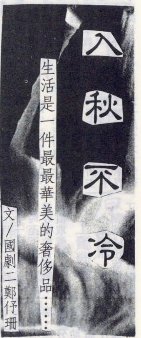
生活是一件最華美的奢侈品……