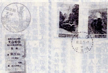
森林火車郵票首頁封 Alpine Train Postage Stamps F.D.C.

阿里山森林火車鐵路，是目前世界上僅存的三條高山鐵路之一，這條鐵路自民國元年通車以來，迄今已有八十二年的歷史。由最早以運送木材為主的鐵路發展成爲今天以客運爲主的高山觀光鐵路；從最原始的蒸汽火車頭，進步成爲最現代化柴油火車，這一條鐵路已經成爲我國寶貴的文化資產。阿里山森林火車起點爲海拔三千公尺的嘉義市，蜿蜒爬升至二千二百一十六公尺的阿里山站，行經熱、暖、溫三個林帶，沿途天然勝景很多，如神木、眠月石猴……等，足以吸引中外遊客前來搭乘。郵政總局爲了配合觀光事業的推展，於民國八十一年十一月五日發行森林火車郵票。