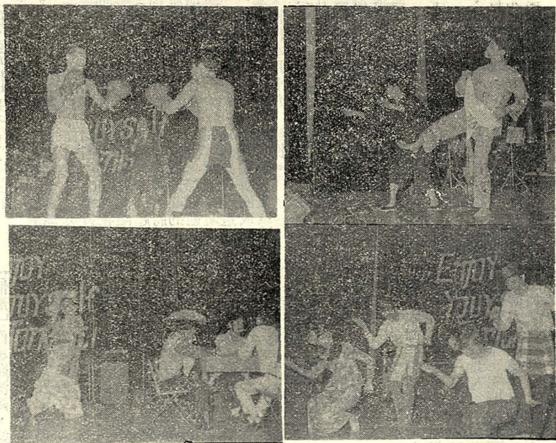
圖與文 本校新聞系於上週五晚在華街大專學生生活中心舉行傳統統左。圖為晚會慶祝會晚慶祝：上右。新任學擔的鳳陽花。左四：新任學擔的木瓜舞。右四：新任學擔的拳擊賽。右四：新任學擔的李濤主持的拳擊賽。左四：新任學擔的仁哲(仁哲程)。中當正日的演表學同