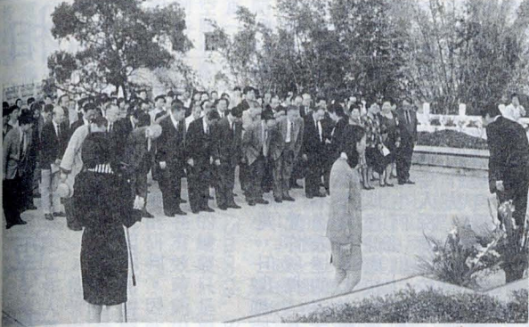
敬致園曉注前生師校本，誕冥三九人辦創張↑