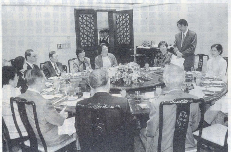
→ 張董事長在午宴中，以英文致詞，闡述本校與菲律賓的關係。