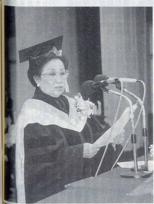
羅慕斯夫人在致詞中表示，獲頒名譽博士學位，不只是她個人的榮耀，也是菲國全體人民的榮耀。