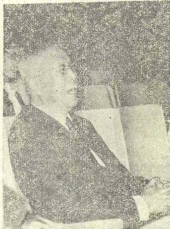
張創辦觀後開心笑了 。來出