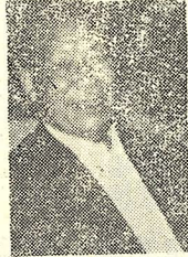
副主劉安祺將 軍觀「守財奴」。