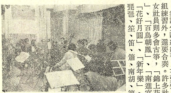
低眉信手續繡 大珠小珠落玉盤

社員中，女同學多來自中文系。她們認為讀中文系，是理所當然該學國樂。此外，國樂悠幽的曲聲，也是吸引她們的主因。 集訓分四組練習，有彈弦、拉弦、吹管和古箏，除分組練習外，還要合奏。許多社員兼習兩種以上的樂器，女社員則多會古箏，「錦上花」、「千聲佛」、「上樓」、「百鳥朝鳳」、「南進宮」、「平沙落雁」，或是「花好月圓」、「新年樂」、「蓮池仙踪」等，會合了琵琶、笙、笛、簫、南胡、箏、揚琴和其他彈弦樂器，曲曲動聽，幽幽傳出，爲此人跡罕至的無人城，更添了神秘的色彩。 短短的集訓期間，社員們規律地生活着，天天自大清早到夜間，十點多，一同吃飯，有刺骨的狂風和冷冽的暴雨，裏面却有妮妮的樂聲和暖暖的友情。這一群國樂的愛好者，他們在苦練中，浸透了天，他們也滿足了太多，太多。