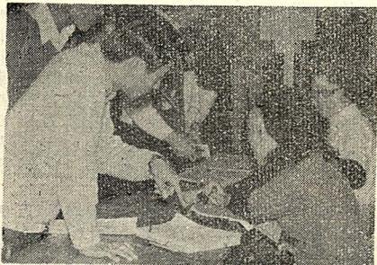
【圖與文】補辦註冊手續，於昨日（三十）免以握把必務學同辦未，行舉今日及日（誤孰）。

此次聯席會，主要目的在研討六月十八日本校園遊會有關籌備事宜，及如何推廣各項有關學術之活動，並聽取社團負責人有關