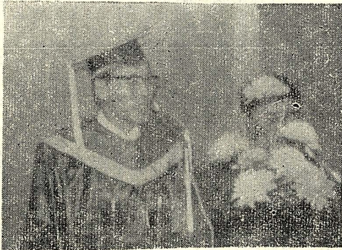
岡田武彥博士在接受哲士學位後致謝詞

【本報訊】日本陽明學者岡田武彥博士，昨日上午十時半，在本校逸仙堂，接受中華學術院頒贈的名譽哲士學位。 頒贈典禮由中華學術院院長張其昀主持，典禮由張院長致詞，其詞略謂：岡田博士，其作品內蘊甚鉅，其宏揚中華文化，其具貢獻。岡田博士在致詞中表示：他今日能接受中華學術院之榮譽，實感榮幸。其詞略謂：岡田博士，其作品內蘊甚鉅，其宏揚中華文化，其具貢獻。岡田博士在致詞中表示：他今日能接受中華學術院之榮譽，實感榮幸。