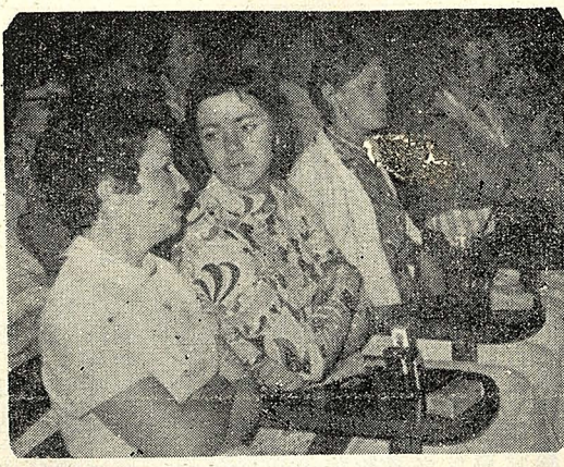
△圖為基督教女青會的來賓，昨日在大成館觀賞，由本校五專同學所表演舞蹈的神情（本報記者陳安蓉）

【本報訊】中華學術院院長張其昀博士，將於今日上午十一時，在本校逸仙堂，頒贈日本大久保傳藏先生名譽哲士學位。大久保傳藏先生，衆議院議員、山形市市長，並首創日華親善協會（即今山形市的日華親善協會），日本全國現已有十五個日華親善協會。大久保傳藏先生，為促進中日兩民族感情，曾以十五年時間，蒐集資料，寫成「一頁珍貴的歷史」一書，該書以個人心聲表達日本人民公意，書內聲言「日本經濟高度成長，躋身經濟大國之林，皆係受中國總統蔣公德政的幫助。」該書現已刊行十三版，銷行日本全國，並譯成中文本已由我國海外出版社出版。