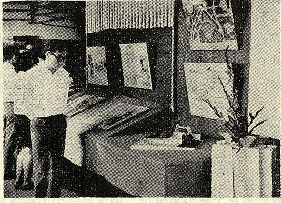
圖與文 建築系二年級班展，於昨日起在大義館三樓展出，圖為會場一角。

【本報訊】據教務處課務組表示：本院六十六學年度大學部及五年制專修科畢業考試，已訂於六月五日（星期一）至六月十日（星期六）集中舉行，自六月二日（星期五）起應屆畢業生開始停課。 凡各項有關術科、會話、語音學及演講等不舉行筆試科目，由各任課教師於停課前一週（五月廿六日至六月一日）自行測驗。 本屆畢業考試日程係按平時上課課程表安排統一考試，為便利收取試卷與及早評分起見，教務處請各任課教師按上課時間到校主控，畢業班各代表希於今日至教務處課務組領取「畢業考試通知」，轉送各任課教師。 【本報訊】據教務處課務組表示：各本學期需印之講義，請於六月十二日以前送交該股，逾期將不再受理。