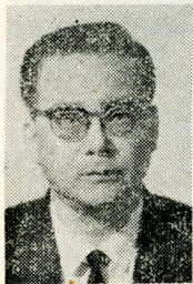
張主任自接任以來，勇於任事，不負重托，他有兩個願望，第一就是希望同學畢業後在戲劇界服務，第二就是希望同學將來轉入大學部相近科系繼續深造。

張主任是河南人，現年五十歲，北平中國大學畢業，早年曾留學日本，曾任大鵬劇團教導主任、空軍藝工大隊隊長等職，而且隨該團到海外作巡迴演出。張主任認為我國的國粹，對海外則足以代表我國文化的一部份，甚至在今日這個高度工業化與洋風充斥的社會裏，平劇並沒有被漠視，相反的，更為一般有心之士所提倡與重視。 數年前，空軍大鵬劇團，曾前往歐美作巡迴性的演出，深得一般外國人的讚賞與好評，而且來觀的人，皆是各國名流與高階層人士，如英國外相夫婦與摩洛哥親王妃的親自蒞臨捧場，他們對中國平劇瘋狂的嚮往與愛慕程度，絕不亞於當年國人對樂視影片中的凌波。 張主任自接任以來，勇於任事，不負重托，他有兩個願望，第一就是希望同學畢業後在戲劇界服務，第二就是希望同學將來轉入大學部相近科系繼續深造。