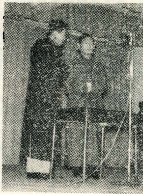
本校日、夜間部同學除夕晚會，各項精彩表演鏡頭。圖①芭蕾舞表演，②相聲，③幸運獎抽獎，④心弦合唱團，⑤鋼琴獨奏。