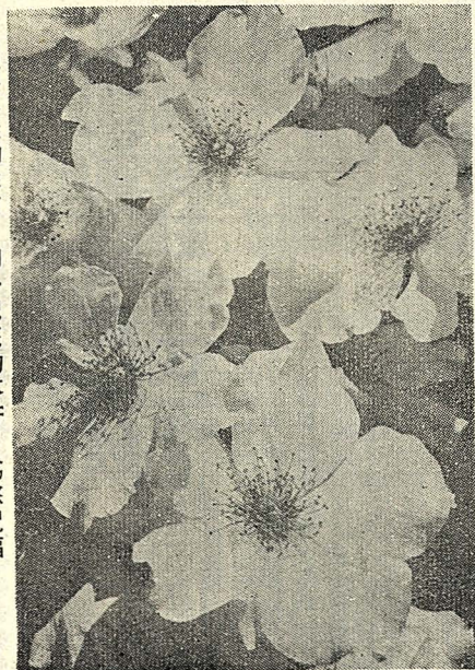
在這花樣的季節，掬一把花的芬芳，爲您祝福！