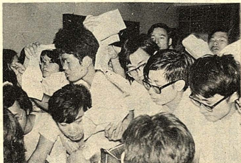
舊生註冊在華岡銀行繳費擁擠情形。