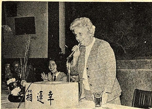
院長夫人於華岡女青年迎新晚會中，說了兩句中國話：「你好！祝你幸福。」

(本報訊)新生杯球賽，將於今天中午十二時十分，在大仁館前籃球場，正式點燃戰火。 此次報名隊伍極為踴躍，計有男子組：足球三十四隊，籃球三十六隊，排球隊。並已於十六日中午舉行領隊會議，系辦公室旁的佈告欄：排球十七隊，會中抽籤決定各組賽程，賽程表已