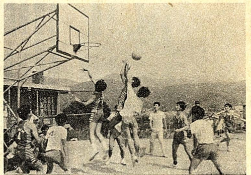
圖為雙方爭奪籃板球之精彩鏡頭。(圖與文朱言龍)