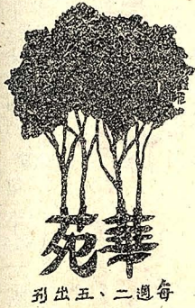
華苑 刊出五、二週每

「烤肉」對我一言是一個新的名詞，自從跟班上同學一起去外雙溪烤過一次後，我才知道這和家鄉的「烤番薯」類似——只是烤的東西不同而已。在以後不久，我又瞭解了一樁神秘的事：在一間洋溢著音樂而漆黑的屋子裏，人影憧憧，那就叫「舞會」。