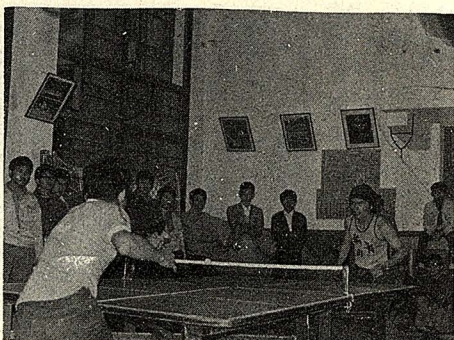
系際杯桌球賽在大義館舉行初賽時的情形。(奚慧國)