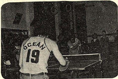
系際杯乒乓球比賽前天在大義館的二樓舉行，各系的代表殺得一來一往，互不相讓，看的人緊張，打的人更緊張。