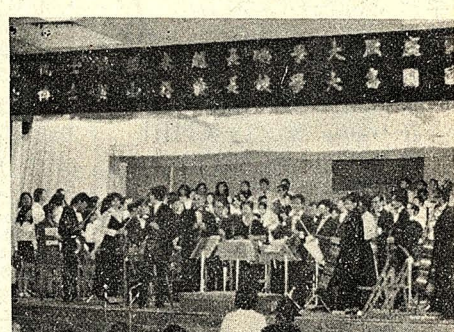
日前岡華交響樂團假大禮堂 (本報記者鍾強國)

代表聯席會及社團聯席會。提案請於七日中午以前，送至學生活動中心第五辦公室學部代表委員會處。