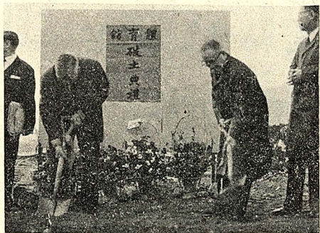
校慶日體育館舉行破土典禮 (本報記者鍾強國)

(本報訊)一項由本校學生參與工作，以全省各廠商為對象的「企業景氣預測調查」已於十一月廿七日開始進行。這項由西德 IFO 於判斷未來的市場經濟研究所創辦的調查方法，主要特點為不記名，不問數字，而以經理人員的意見為根據，作成快速的預測情報提供各企業單位，使工商企業界易於了解。現已來台的西德 IFO 經濟研究所負責人 W.H.S. T. riegel 博士，對此一調查計畫曾表示熱烈支持。並曾提供寶貴意見。並同意本校參加此一企業景氣預測調查。國際組織為團體會員。IFO 經濟研究所表示在將來願意協助我國解決技術上的困難，以期該項調查的成功。