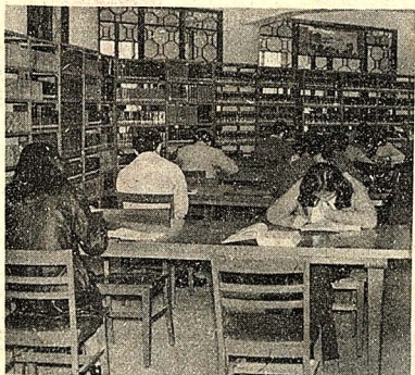
智慧庫之一角, 說不能不幸福? (圖與文: 慧文)

從圖書館的正門走入, 向左繞過校史室, 一眼望見「參考閱覽室」, 請將您的書本擺在兩旁的木架上, 輕輕的走進, 繞著外層, 您可以任意翻閱印刷精美的畫冊, 以及中國歷代的文憲及小說。需要自己系裡的參考書, 可在內層的書架裏尋找。您希望借幾本散文、傳記或科學籍回家慢慢閱讀嗎? 閱覽室中有六