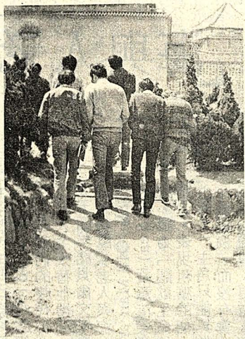
操場旁的小路高原不低平，現已修整平坦的小道。

長髮同學 盡速複檢 （本報訊）訓導處發出最後「通牒」，限令留長髮的同學「盡速複檢」！