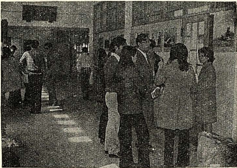
圖，躍擁常非學同的試考作合教建局開新加參。形情之試口待等外室為