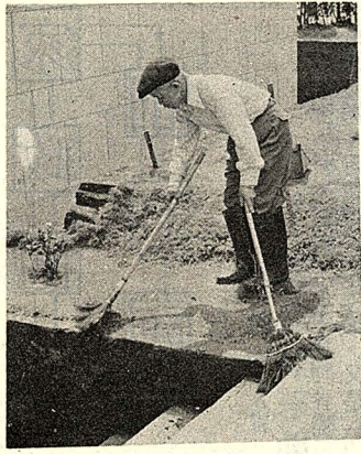
一把不夠，兩把來，本校的清潔工作，全靠榮民打掃。