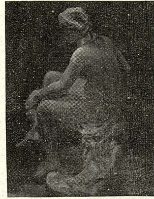
品作幅二其展班二美 (攝波靜黃)