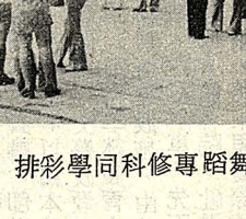
舞蹈專修科同學排舞