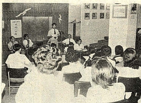
（國慧奚）況盛之會談座【鷗沙一地天】

（本報訊）第一屆全國大專杯足球賽，本校榮獲甲組亞軍。冠軍由省立體育會獲得。在比賽中，本校曾以二比一的成績力克上屆冠軍台北體專。去年，本校為第四名。此屆比賽在桃園中正理工學院舉行，賽程由上月廿八日開始，甲組已於前（三）日結束。活動中心將準備水果慰勞球員們。