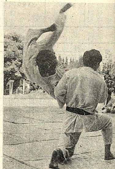
第三屆華岡柔術錦標賽，昨於大義館前舉行。

新加坡 贈我獎學金 (本報訊)新加坡南洋大學贈送我國學生獎學金六名。凡本校前三年制專科畢業生(不限科系)民國三十七年五月一日以後出生，並已服完兵役者，均可參加甄選