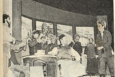
「長」劇中「勇闖虎穴」之一景。