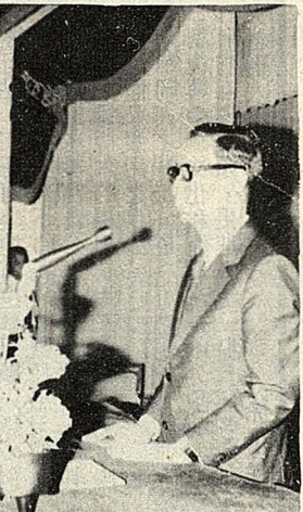
昨日專與國農所農家所講本報記者純是題者青在國