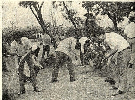
圖為淨化運動，同學們熱心參與。（黃靜波）

卸任後的蕭院長，將俟其本身職務告一段落後，於七月間親赴西德主持世界文化交流研究發展會議，此項學術性會議係由西德象徵徵研究會舉辦，蕭院長擔任該會會長職位，其下另有副會長四人，分別是德籍、澳籍、日籍及日本籍學者；該會宗旨在研討各種專門學問的根本理論，並積極促進世界文化交流的影響，全部會員計有五百多人，其中有一百五十多會員