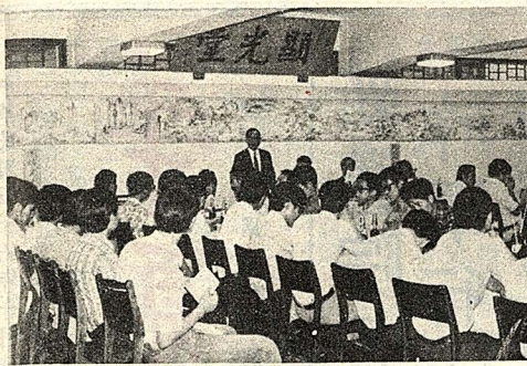
(圖與文)前僑委會委員長高長信於世界華人研究社成立大會中致詞。

建築系轉系考試的科目計有微積分、物理、基本建築圖、徒手畫、參加考試的同學須自備丁字尺、三角板、製圖儀器、橡皮、