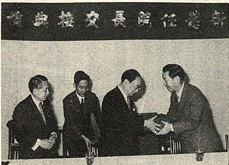
由泰寶喬長院新任，禮典交接長院舊新任人交監 信印過接中手鑑良查人交監

(本報訊)本院院長、副院長及研究部主任、教務主任、訓導主任交接暨華學中心主任、體育館籌備主任之就職典禮，已於昨(一)日上午九時假大恩館五樓華岡學會會議室舉行。院長、副院長之交