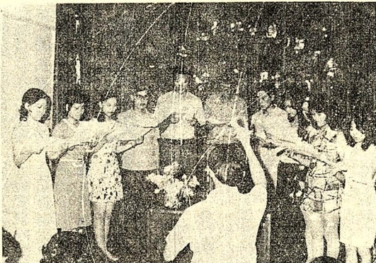
圖爲華岡詩社參加校外詩歌朗誦情形

（本報訊）因期中考的關係，攝影社預定本星期五晚的活動暫停一次。下星期五該社的活動時地照常，敬請社員注意。