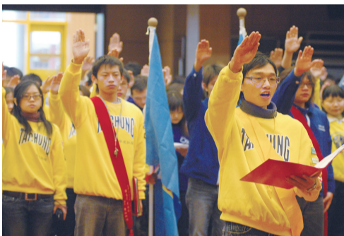
華岡人誓言將服務心觀念發揚光大

所組成。在「與活動結合模式」上已透過社團服務學習活動的方式進行，例如帶動中小學活動、海外志工團等；「與課程結合模式」方面則透過輔導各系所將專業課程納入服務學習內涵課程，並強調歷程需要符合服務學習的規劃步驟。