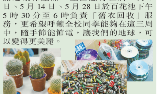
廢棄光碟及電池更換環保產品

農學院各系學會及畢業生服務委員會亦於4月29日至5月1日進行配合進行環保回收展，以廢棄光碟及電池更換相關之環保產品，並由慈青社於4月3日、5月14日、5月28日於百花池下午5時30分至6時負責「舊衣回收」服務，更希望呼籲全校同學能夠在這三週中，隨手節節節電，讓我們的地球，可以變得更美麗。