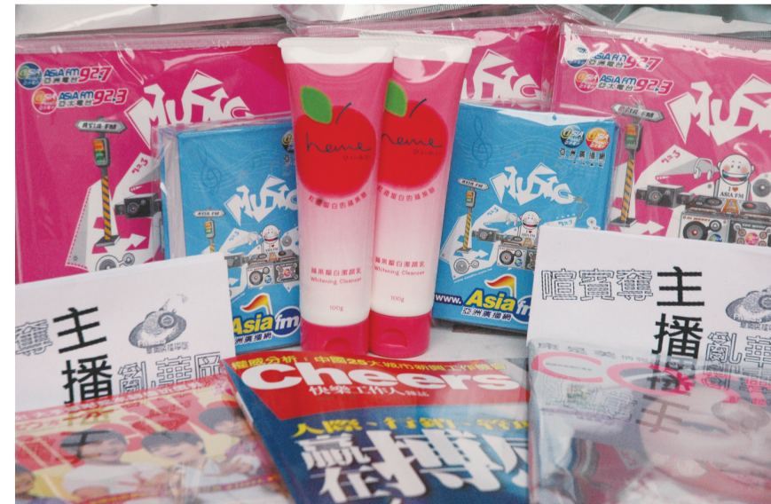
華岡電台與 ASIA FM 共同合辦校園主播大賽

華岡電台的主播大賽台語組的初賽日期為4月30日，國語組的初賽日期為5月2日，皆為早十時在大成館新聞系館內進行。