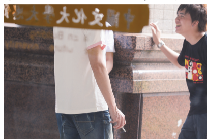
無菸環境你我之責

【文／張紹康】全校禁菸，華岡人動起來！學務處表示，根據96年7月11日公布之菸害防制法規定「大專校院室內場所全面禁止吸菸，且大專校院室外場所，除設置之吸菸區外，不得吸菸」，配合規定，學校設置三處校園吸菸區，分別是「大恩館與大功館間空地」、「大義館正門空地」、「大倫館對面樹林旁」等三處，其餘場所，一律禁菸。為推廣禁菸的觀念，學務處生輔